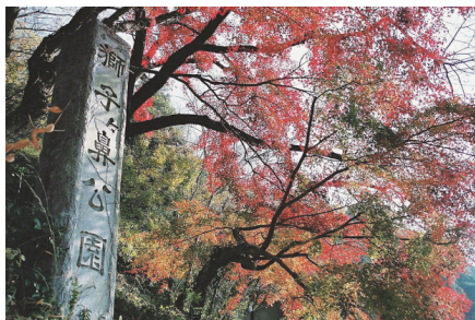
遊歩道やアスレチックが整備された公園

東名高速磐田ICから車で約20分の場所にある福田漁港。海中内のサンドバーが動きやすいものの一定かつ多様な波が上がることから、ピギナーから上級者まで集います。