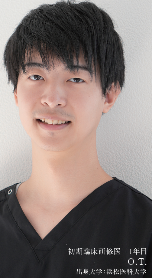
初期臨床研修医 1年目 O.T. 出身大学:浜松医科大学