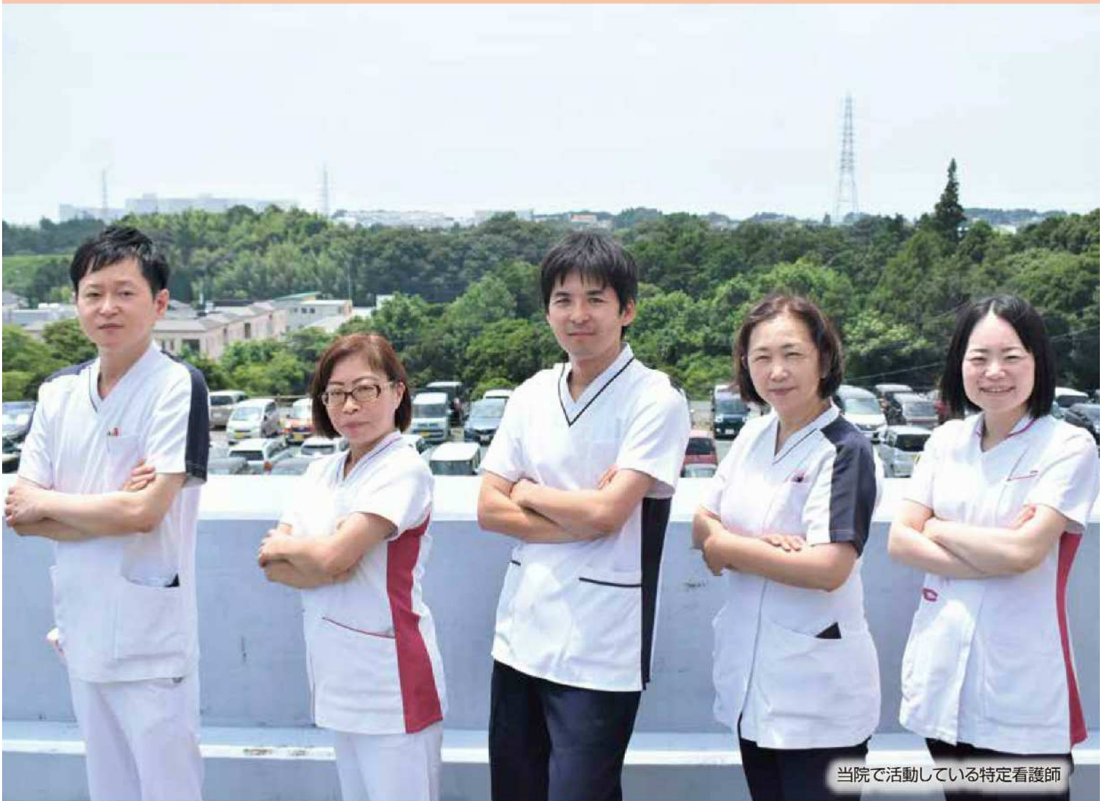
当院で活動している特定看護師