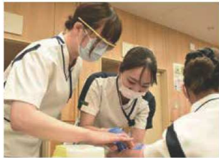
インジェクションナース指導風景

当院では、クリニカルリーダーレベル取得のための様々なプログラムを用意しています。あわせて、新人看護師には新人看護師臨床研修プログラムを実施しています。これは、クリニカルリーダーに含まれる知識や技術だけでなく、専門職業人としての態度や職業倫理を育成することを目的としています。磐田市立総合病院の看護師としての自覚を養い、看護の素晴らしさを実感し、看護に対する誇りが持てるよう、スタッフ全員が新人を支援し、幾重ものサポート体制を構築しています。2年目以降も継続的に支援し、卒後教育としてクリニカルリーダーレベルII取得を保証しています。その後は、自己研鑽を積んで当院の標準的な看護師像を示すクリニカルリーダーレベルIIIを取得しています。さらに、ジェネラリストとしてクリニカルリーダーのレベル