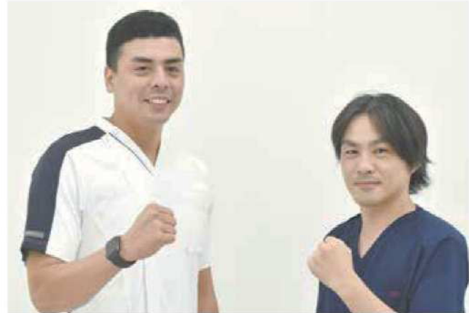
受講者の当院認定看護師

現在、5名の特定看護師が7分野で自院での実践を行っています。特定看護師の資格取得には、共通科目として252時間の講義と実習を行います。さらに分野毎に区分別科目の講義に加え、演習・手技については指導者からの演習の合格を頂いて初めて臨床実習を実施します。特定行為研修機関として開講する初年度は、2名の当院認定看護師が術中の麻酔パッケージ領域を受講します。本来熟練した知識と技術を持った看護師が、さらに学びを深め手順書に基づいて実践していきます。患者さんは安心して特定行為を受けて頂けると思います。