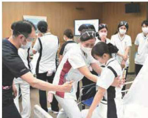
理学療法士による介助研修風景