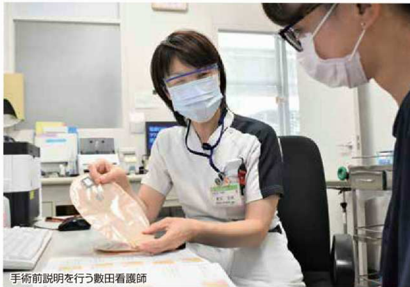
手術前説明を行う数田看護師