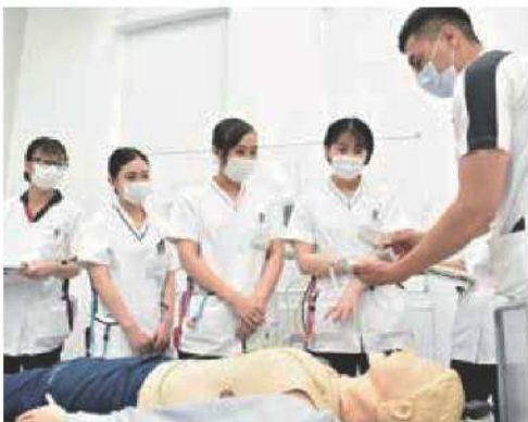
救急看護認定看護師による研修風景

アップ、スペシャリストとして専門・認定・特定看護師等の資格取得、または看護管理者としてマネジメントリーダーの取得など、その後も専門職として進化し続け、時代の変化に合わせた質の高い看護を提供できる看護師の育成に努めています。