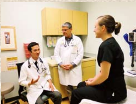
ミシガン大学での研修