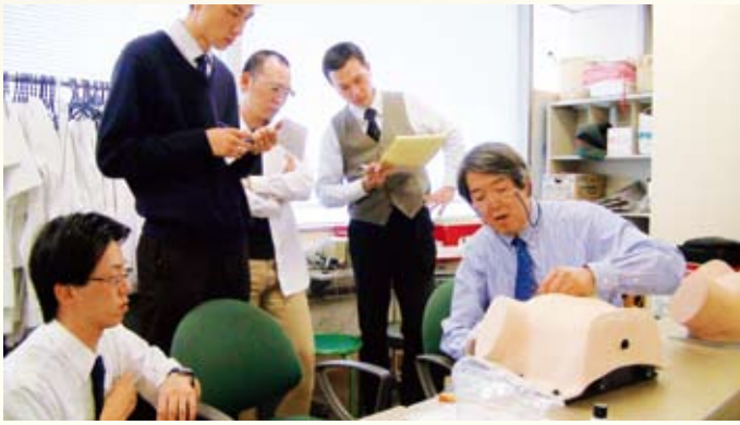
婦人科診察法の練習