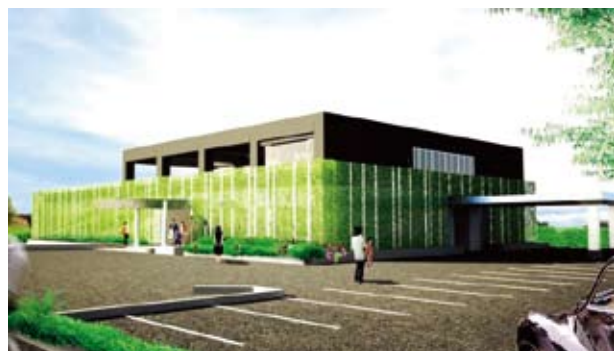
菊川家庭医療クリニック完成予想図