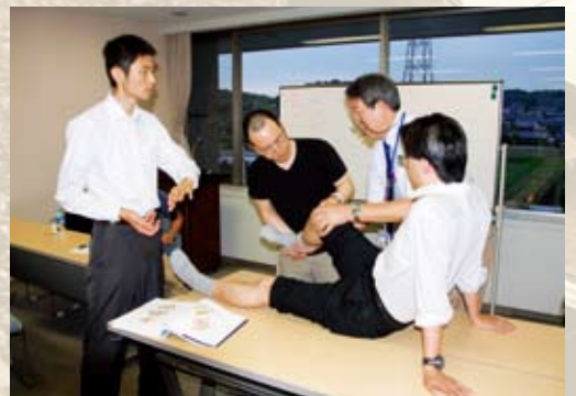
整形外科的診察法の練習