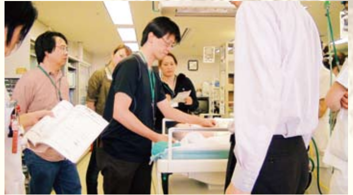
新生児蘇生法の講習会